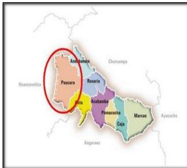
Gráfico n° 2 Ubicación del Proyecto toma Google Map