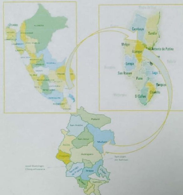
Mapa N° 01: ubicación geográfica