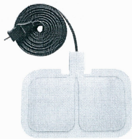
Fig. No. 1: Placa de retorno indiferente adulto (Imagen referencial)