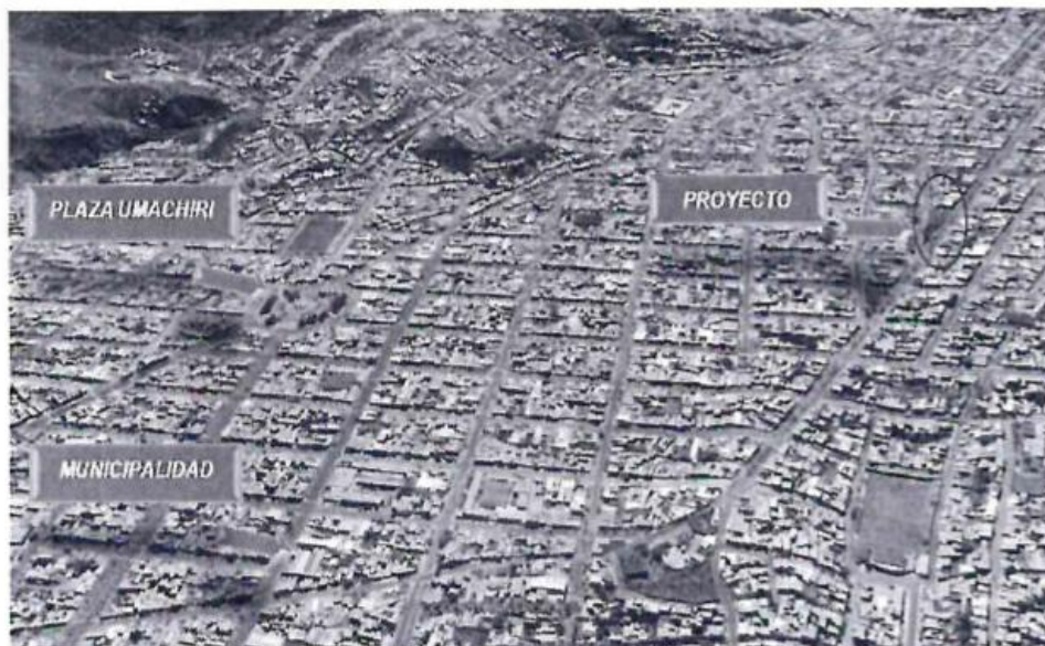
IMAGEN DE UBICACION

MUNICIPALIDAD DISTRITAL DE MARIANO MELGAR