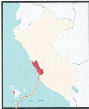
Ubicación Regional (Lima)