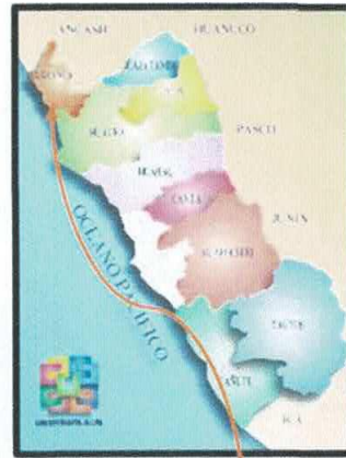
Ubicación provincial (Barranca)