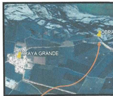
Vista satelital del proyecto