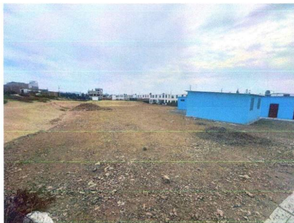
Figura N°4: Situación del Terreno del proyecto