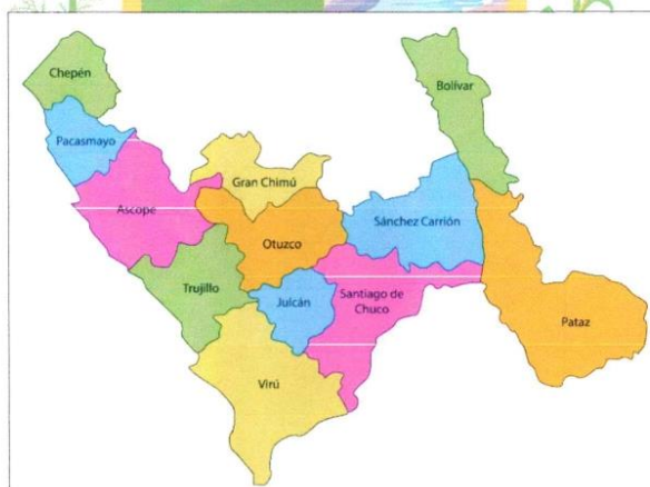
Figura N°01: Ubicación de la provincia de Virú