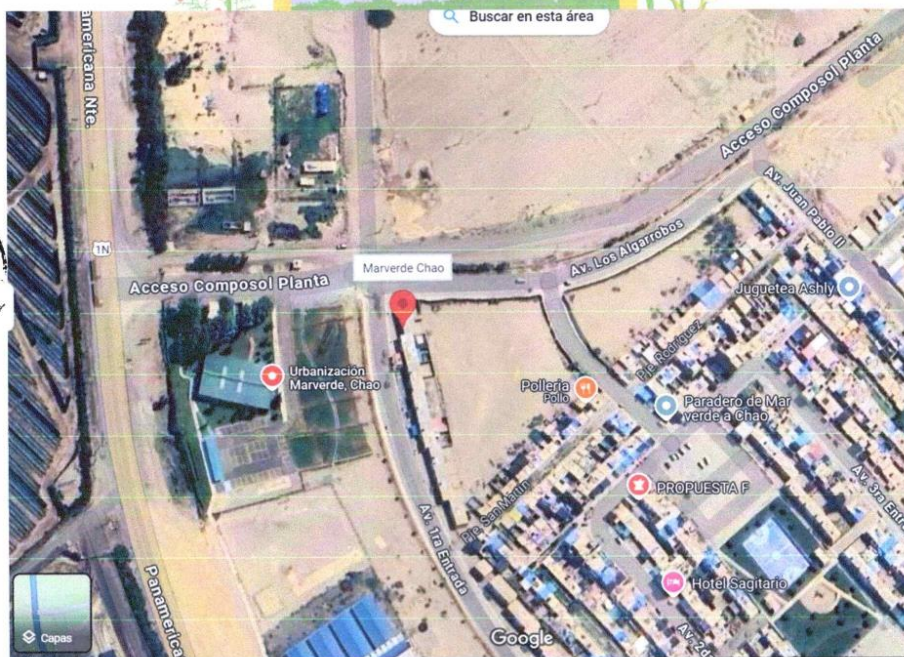
Figura N° 3: Esquema de Ubicación General de la I.E.