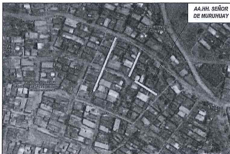
IMAGEN N° 1: Ubicación del terreno

Latitud/Longitud: -12.12553947235129 / -76.95028267928934