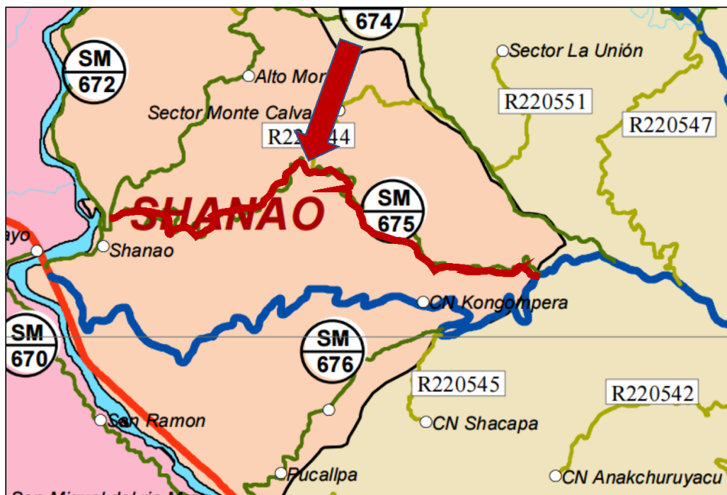
Fig. 01. EMP. SM-104 – SHANAO, L= 08.290 KM.

Servicio de ejecución del mantenimiento rutinario del camino vecinal, Tramo: EMP. SM-104 – SHANAO, L= 08.290 KM.