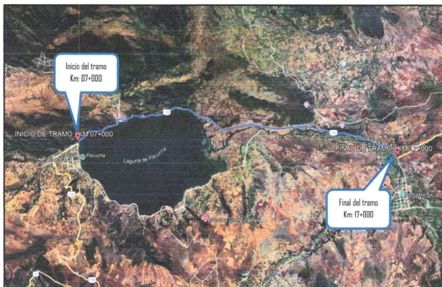
Imagen: Vista satelital del tramo a intervenir

Carretera Panamericana Sur Lima-Chincha-San Clemente, la cual es una vía asfaltada y pertenece a la Ruta Nacional N°1-S, desde San Clemente se continua por la vía Libertadores Wari pasando por las localidades de Huaytara - Allpachaca - Ahuayro - Uripa hasta llegar a la Provincia de Andahuaylas, esta vía es asfaltada la cual forma parte de la carretera 28A y la ruta nacional 3S, para llegar a la ciudad de Andahuaylas se recorre un total de 759 km aproximadamente en bus, representado este un total de aproximadamente 15 horas de viaje.