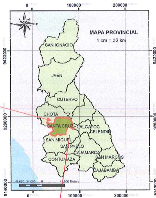
Imagen N° 02: Mapa de ubicación provincial de Santa Cruz