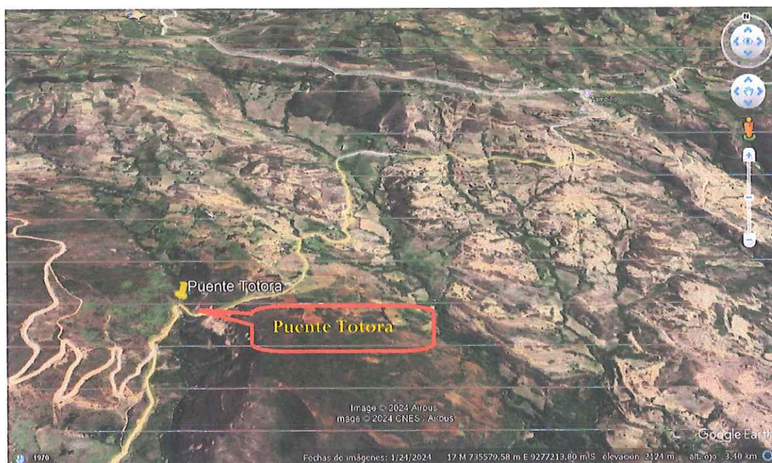
Imagen N° 04: Localización del Proyecto.