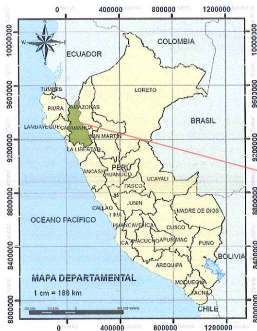
Imagen N° 01: Mapa de ubicación región Cajamarca