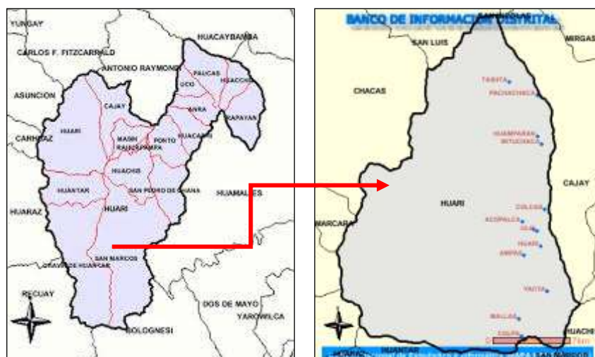
Imagen N°02: Ubicación del distrito Huari

Noreste : Con el Distrito de san Luis de la Provincia de Carlos Fermín Fitzcarrald Sur : Distrito de Huantar de la Provincia de Huari Este : Distritos de Cajay, Masin y Huachis de la Provincia de Huari. Oeste : Distrito de Independencia de la Provincia de Huaraz, Distritos de Aco y Marcará de la Provincia de Carhuaz y Distrito de Chacas de la Provincia de Asunción.