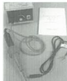
Equipo de Pruebas por Chispa Eléctrica

En el caso particular de que no fuese posible utilizar el procedimiento de caja de vacío debido a que la geometría de la superficie sea muy irregular o curva (esto debe determinarse antes de ejecutar la soldadura por extrusión) se puede evaluar la estanqueidad de la unión por medio de la prueba de chispa eléctrica. La prueba de chispa eléctrica se lleva a cabo colocando a lo largo del borde del traslape superior un delgado alambre conductor. Una vez realizada la soldadura este queda embebido en el cordón de polietileno de aporte. En seguida, un dispositivo semejante a una escobilla metálica es conectado a una fuente de 20 kV, el que es guiado lentamente por un operador sobre y a lo largo de la línea de soldadura. La existencia de un conducto libre entre el alambre embebido y el terminal libre producirá que la unidad emita una señal audible.