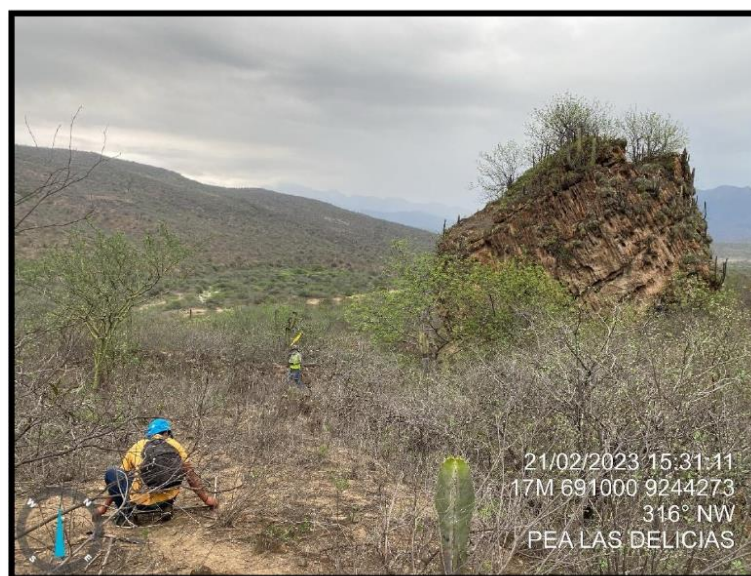
Foto 3. Panorámica, sitio arqueológico Abrigo Las Delicias, conformado por una gran roca producto del desprendimiento del cerro contiguo, su abertura se ubica al lado Este.

Potencial: Bajo. Los cortes realizados indican que el muro no tiene complejidad arquitectónica. No se asocia a otro tipo de evidencias arqueológicas.