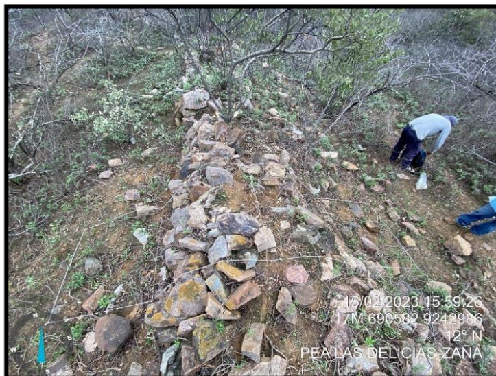
Foto 1: Detalle, sitio arqueológico Muralla Las Delicias 1, elaborado bajo la técnica constructiva de pircado de piedra con orientación Sur – Norte.