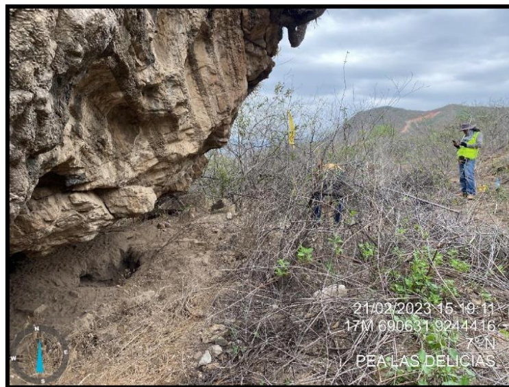
Foto 4. Detalle, sitio arqueológico Abrigo Las Delicias, conformado por una gran roca producto del desprendimiento del cerro contiguo, su abertura se ubica al lado Este.