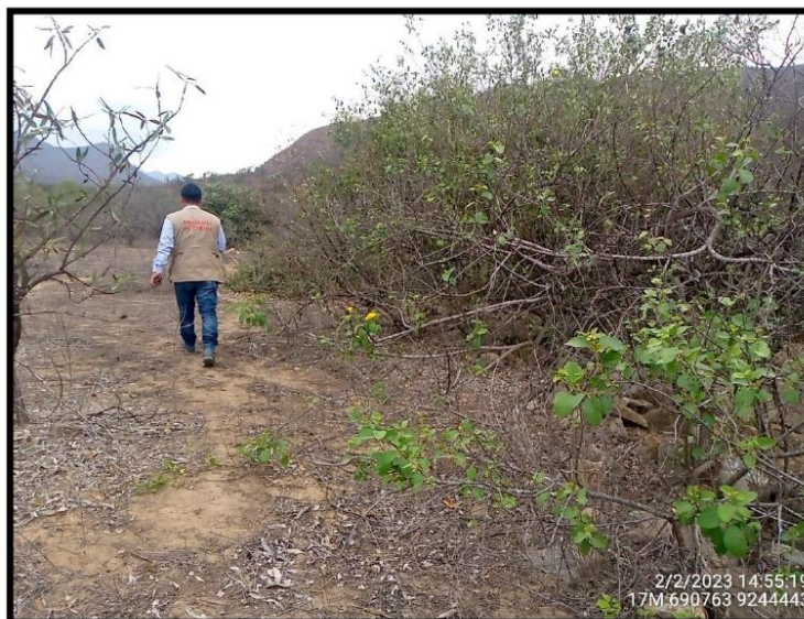
Foto 6. Panorámica, sitio arqueológico Muralla Las Delicias 2, elaborado bajo la técnica constructiva de pircado de piedra con orientación Noroeste a Sureste. Vista, NO - SE