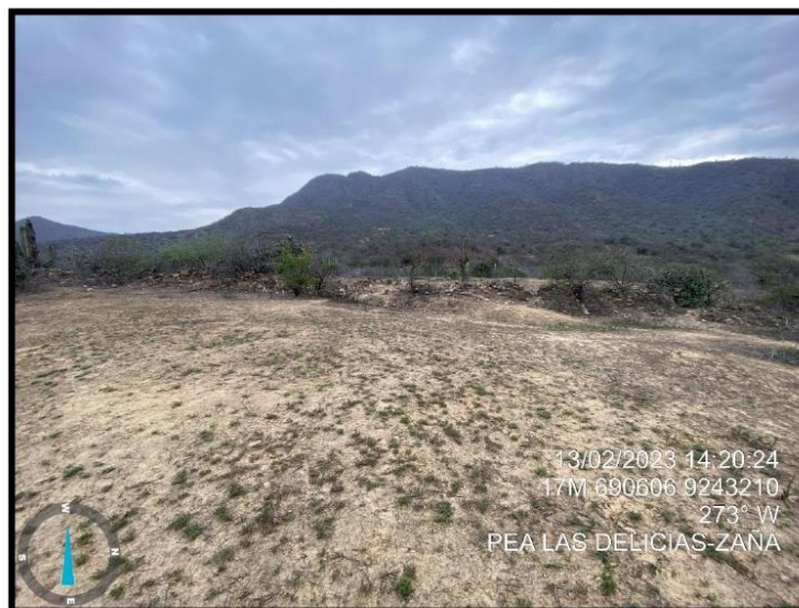
Foto 2: Panorámica, Muralla Las Delicias 1, elaborado bajo la técnica constructiva de pircado de piedra con orientación Este – Oeste.