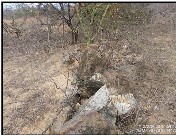
Foto 5. Detalle, sitio arqueológico Muralla Las Delicias 2, elaborado bajo la técnica constructiva de pircado de piedra con orientación Noroeste a Sureste. Vista, NO - SE