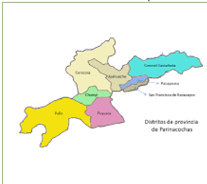
Ilustración 03: Ubicación del distrito de Chumpi