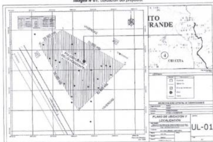
Imagen N°01: Ubicación del proyecto.