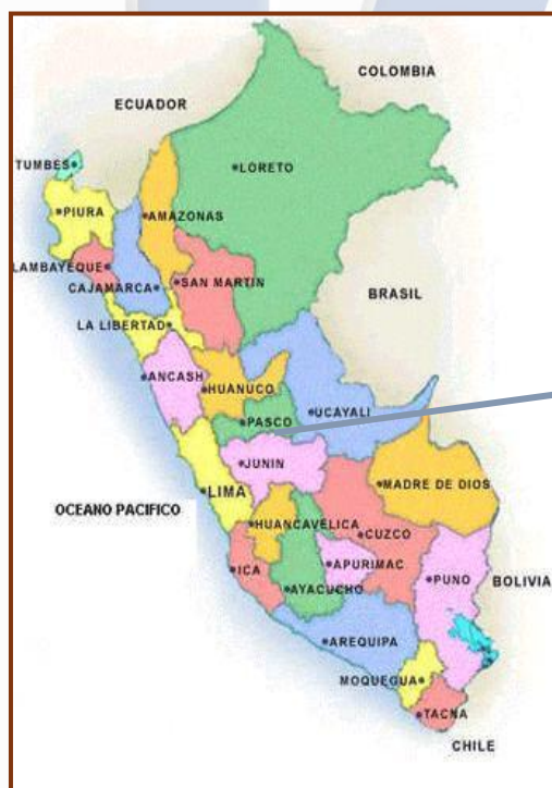
Fig. 1: Ubicación de la región