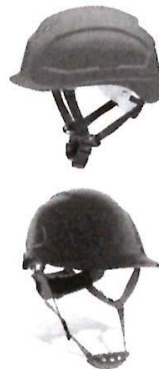
Casco de Seguridad