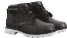
Botines cortos de Jebe