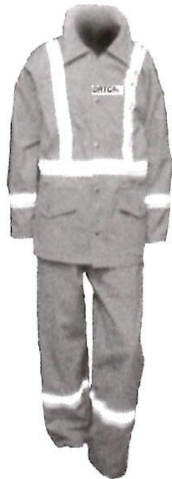
Uniforme de Mantenimiento

“AÑO DE LA RECUPERACIÓN Y CONSOLIDACIÓN DE LA ECONOMÍA PERUANA”