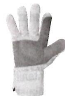
Guantes de Seguridad de Obra