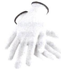
Guantes de Seguridad de Obra