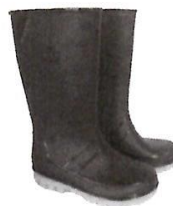
Botas de Jebe