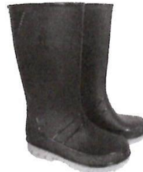
Botas de Jebe