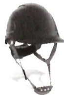
Casco de Seguridad