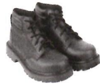
Zapatos de Seguridad con Puntera de Acero