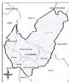
Figura 3: Mapa de la provincia de Utcubamba