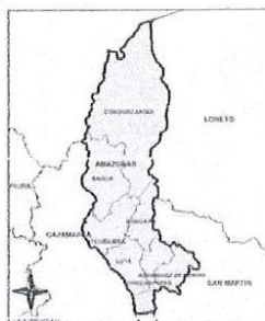
de Amazonas y sus provincias