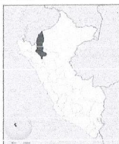
de Amazonas en el mapa del Perú