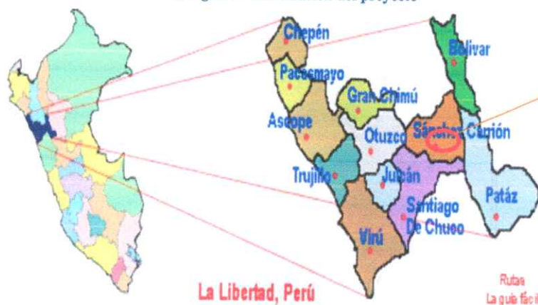
Imagen N° 1. Ubicación del proyecto

Provincia de Sánchez Carrión en la Región La Libertad