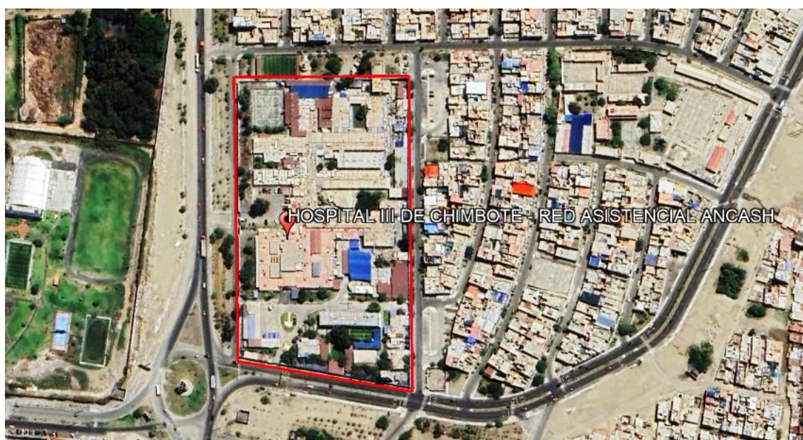
Ilustración 3: localización del Servicio