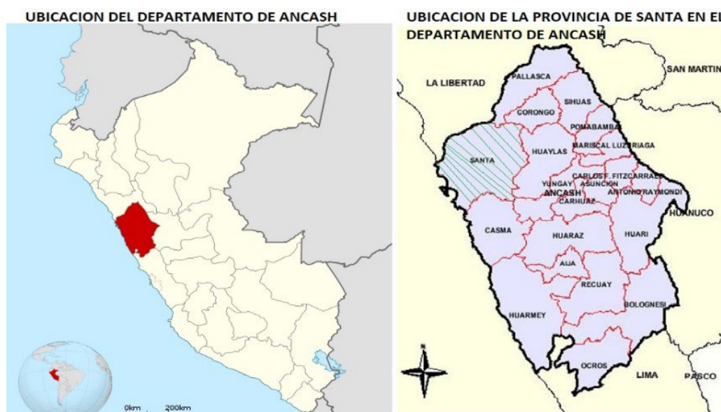
Ilustración 1. Ubicación Geográfica de la Región Ancash – provincia Santa