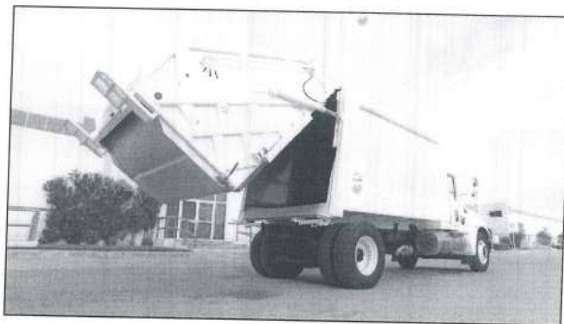
Imagen referencial: Apertura del tailgate.

Luego de este proceso de carga, compactación y descarga, el equipo estará en condiciones para repetir la operación.