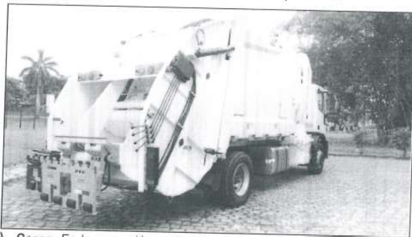
Imagen referencial de un camión compactador.

Las funciones principales del equipo recolector camión compactador son: de forma segura y eficiente, cargar, compactar, transportar y descargar residuos sólidos. Se describe cómo estas funciones son realizadas de manera simple y clara, es importante un conocimiento previo de su significado: