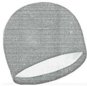
Gorras de licra para natación natación.

Logo: Proyecto Deportes ASA "Hazámoslo Diferente"