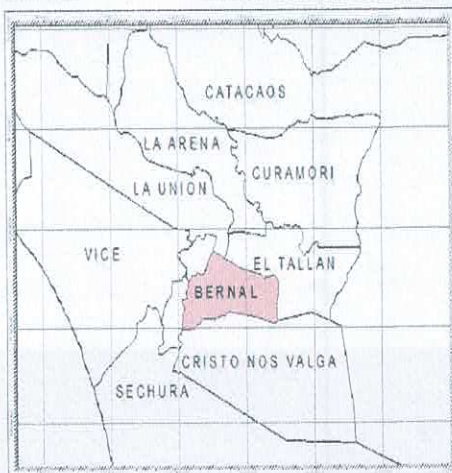
Ilustración 3: Ubicación Distrital