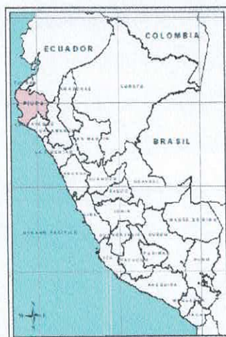
Ilustración 1: Ubicación Departamental

Código Ubigeo: 200803 BERNAL Altitud: 15 m.s.n.m. Coordenadas Geográficas: -5.45861" de Latitud Sur. -80.7417 de Longitud Oeste.