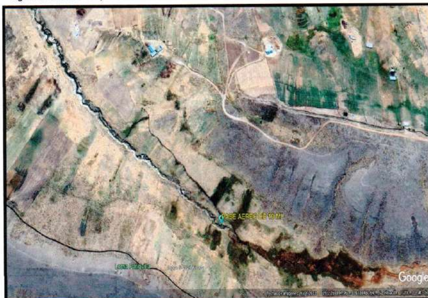
fig.5: ubicación del pase aéreo de 10 ml N: 8346470.95 E: 269154.03 Z:4026.00 msnm