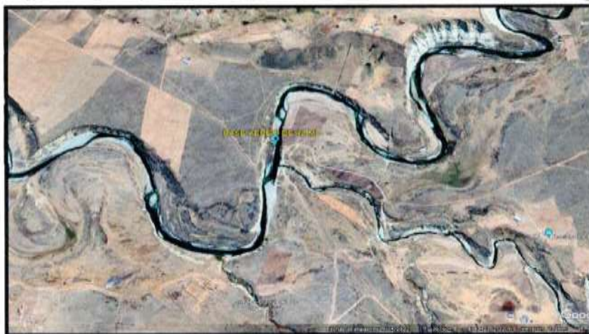
fig.1: ubicación del pase aéreo de 42 ml N: 8341989.00 E: 268489.00 Z:4024.00 msnm

DEPARTAMENTO: CUSCO PROVINCIA: ESPINAR DISTRITO: OCORURO LUGAR: CCPP UNION ANTA