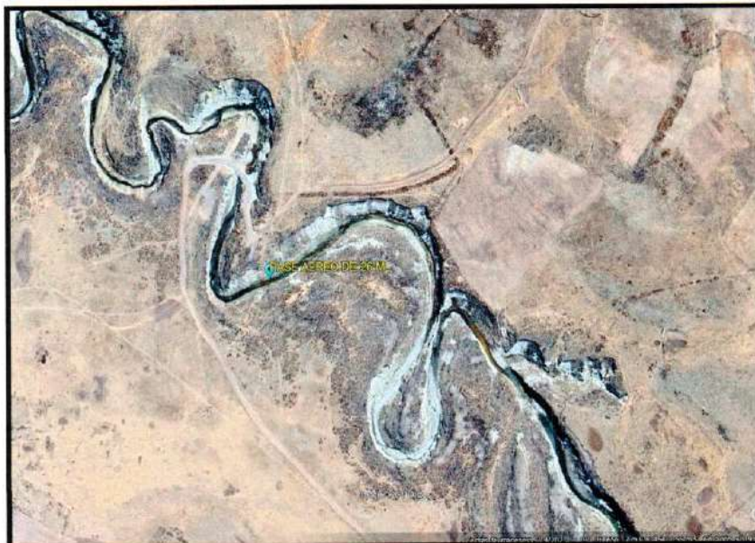
fig.3: ubicación del pase aéreo de 15 ml N: 8345155.44 E: 268571.58 Z:4016.00 msnm