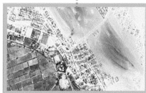
DISTRITO DE OCUCAJE

TERMINOS DE REFERENCIA EJECUCION DE OBRA: "RENOVACION DE PUENTE; EN EL(LA) CAMINO VECINAL IC 108 (PUENTE CORDOVA) EN EL CENTRO POBLADO CORDOVA, DISTRITO DE OCUCAJE, PROVINCIA ICA, DEPARTAMENTO ICA"