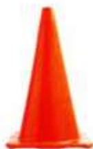
CONO DE SEGURIDAD