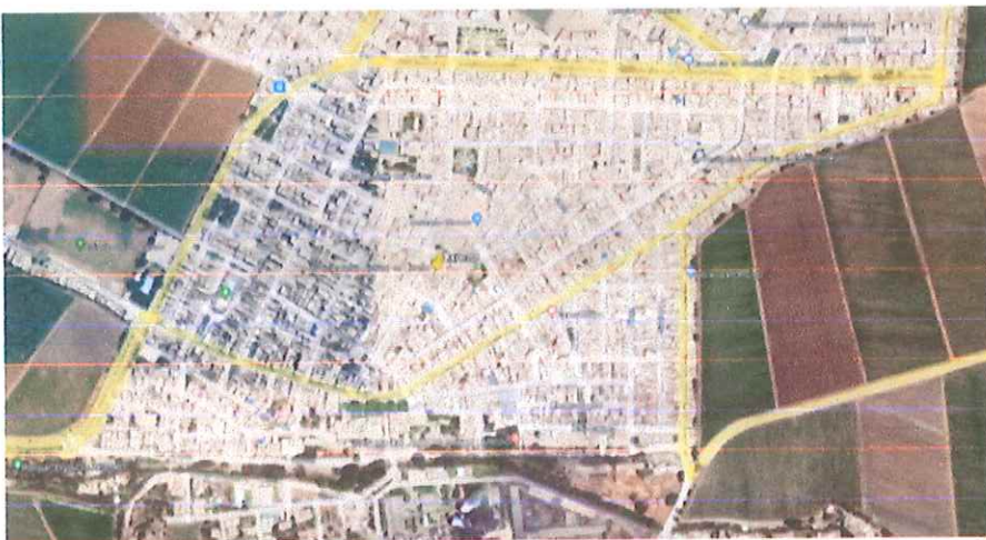
Ilustración 5: Distrito de Laredo