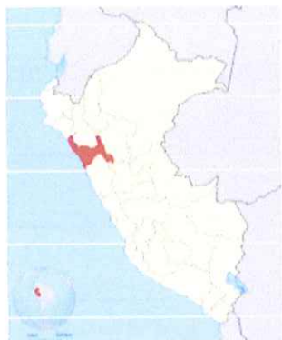
Ilustración 1: Mapa macro de la localización del Perú