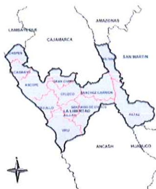
Ilustración 2: Mapa del departamento de La Libertad