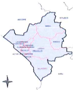
Ilustración 3: Mapa de la provincia de Trujillo