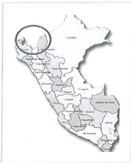
MAPA DEL PERU