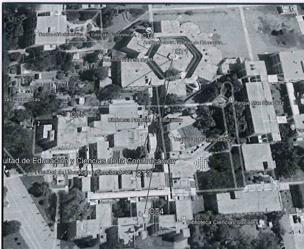
Imagen 01. Vista de la Facultad de educación