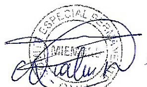
Angella Fiatma Delgado Polo