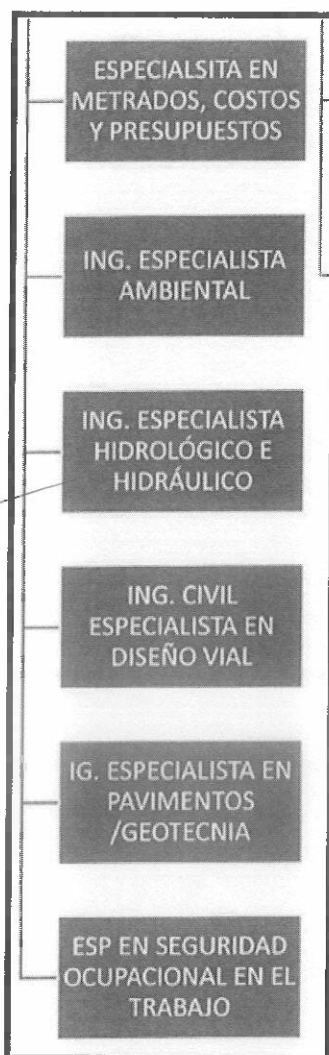
*PERSONAL CLAVE OFERTA