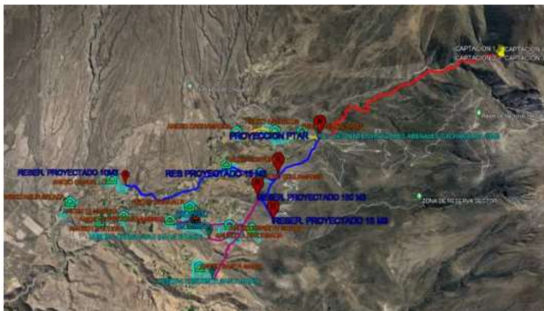
El área de intervención del proyecto