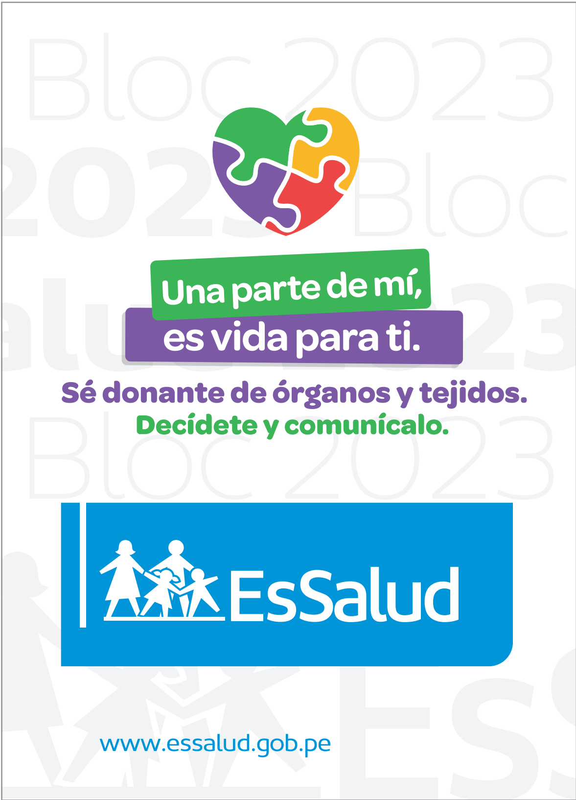
Portada - ancho: 15.5 cm x alto: 21.5 cm