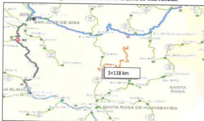
Imagen N° 03: Ubicación de la Zona de Intervención

TÉRMINOS DE REFERENCIA PARA EJECUCIÓN DE OBRA