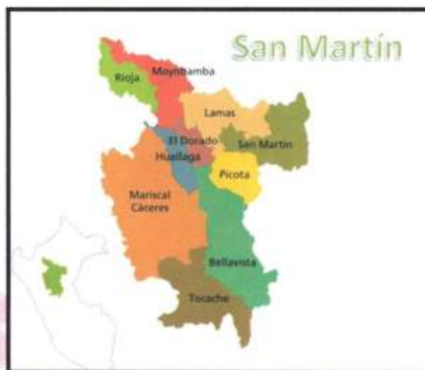
Micro localización Distrito de Bellavista en la Provincia de Bellavista

Términos de Referencia de la Contratación de la Ejecución de la obra: “Reparación de Sistema de Abastecimiento de Agua Potable; Construcción de Conexiones Domiciliarias de Agua Potable; en el (La) Servicio del Sistema de Agua Potable en el Centro Poblado Limón, Distrito de Bellavista, Provincia de Bellavista, Departamento San Martín” con CUI N° 2635647