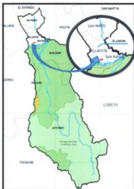
Mapa del Centro Poblado El Limón (Vista Satelital)