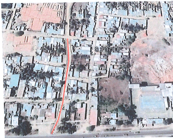
FIGURA 01. VISTA SATELITAL DE LA ZONA Y TRAMO A INTERVENIR

Durante los primeros 3 meses del presente año, se registraron fuertes y constantes lluvias las cuales generaron desprendimientos de terrenos que llevaron a la activación y colmatación del Quebrada El Niño, por tal motivo es de suma urgencia atender la ACTIVIDAD DE EMERGENCIA LIMPIEZA Y DESCOLMATACION QUEBRADA EL NIÑO- VILLA SAN SIDRO - DISTRITO DE CORRALES - PROVINCIA DE TUMBES - DE PARTAMENTO DE TUMBES", la cual al encontrarse colmatada está generando daños. debido a las inundaciones generadas por desbordes a las viviendas aledañas.