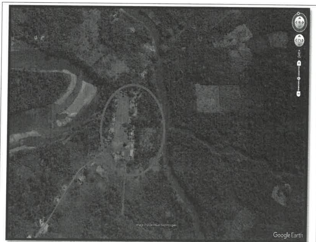
Figura 2: Vista satelital del CASERIO DIAMANTE AZUL.