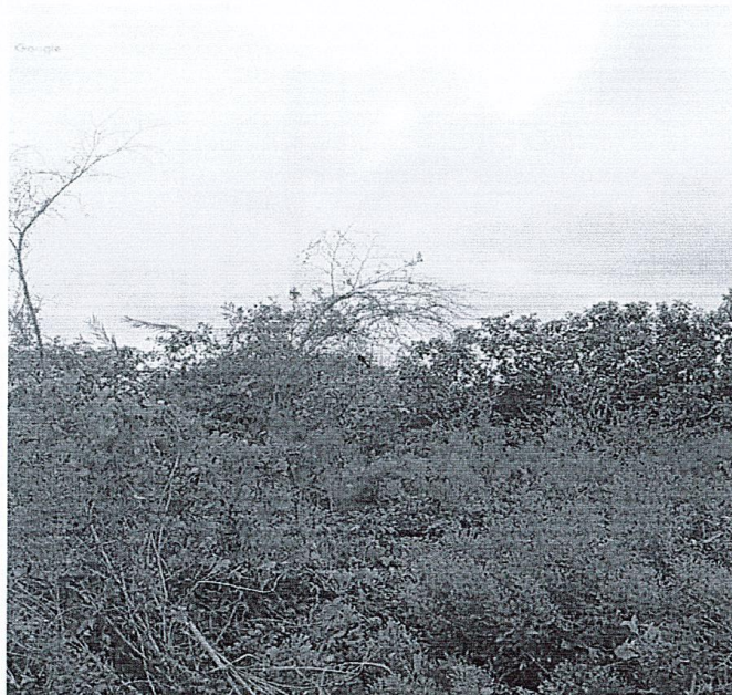
Foto 03: ubicación de acceso al tramo I, en la carretera Chulucanas - Batanes