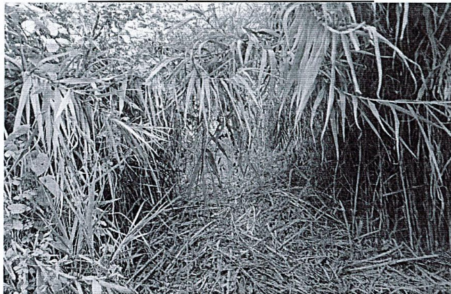
Foto 01: ubicación de acceso al tramo I margen derecho del rio Charanal, el cual se encuentra con presencia de vegetación para el acceso provisional al puente modular charanal a instalar.

"ACONDICIONAMIENTO DE ACCESO PROVISIONAL PARA PUENTE MODULAR SOBRE RIO CHARANAL; EN EL (LA) RUTA: CHULUCANAS-BATANES, DISTRITO DE CHULUCANAS, PROVINCIA DE MORROPON, DEPARTAMENTO DE PIURA".