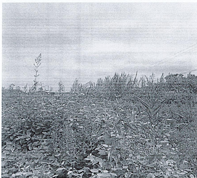
Foto 02: ubicación de acceso al tramo I margen izquierdo del rio charanal, el cual se encuentra con presencia de vegetación para el acceso provisional al puente modular charanal a instalar.