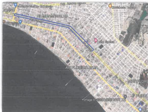
Imagen N°01.- Zona de Intervención, DESDE LA AV. GALVEZ – JR. DRENAJE I ETAPA (dentro de la sección de color Azul)