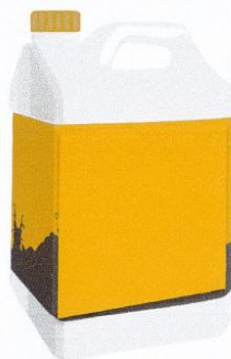
IMAGEN 01: PRIMER O PUNTE DE ADHERENCIA O EQUIVALENTE.