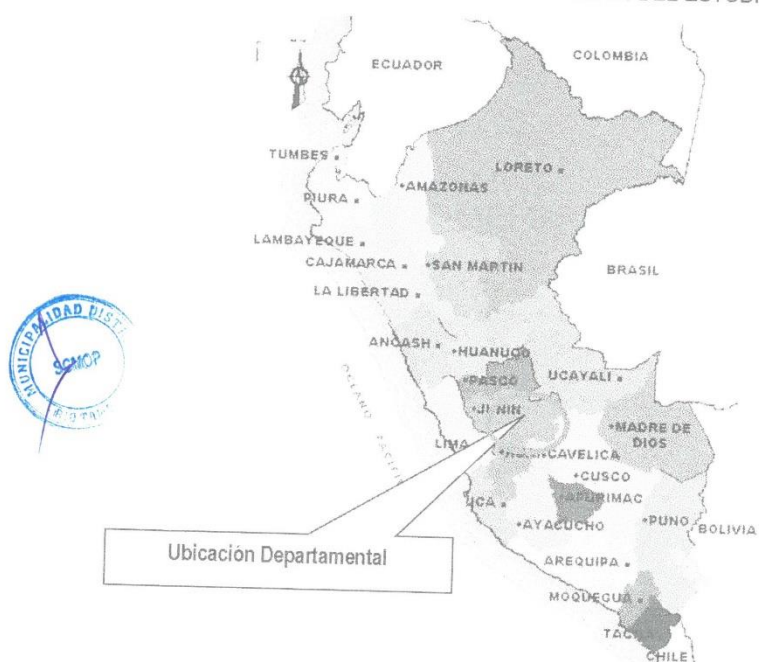
MAPA 01: MACRO LOCALIZACIÓN DEL ESTUDIO

Plaza Principal s/n - Puerto Prado - Río Tambo - Satipo - Junín