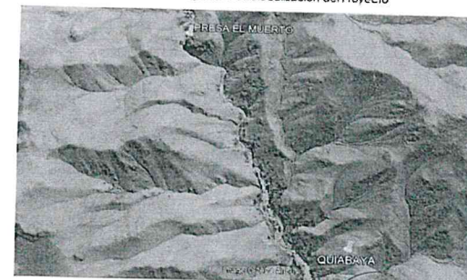
Ilustración 2: Mapa de Microlocalización del Proyecto

Localidad : HIGUERANI Coordenadas : 334752 E - 8084963 N Altitud : 2755 msnm