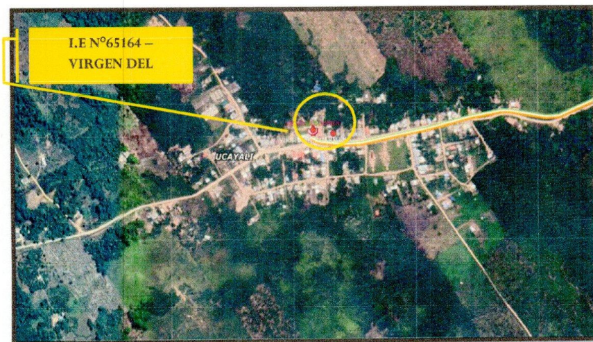
Ilustración 1. Vista Satelital de la Ubicación de la IE en el caserío Virgen del Carmen.