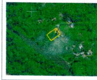
PLANO DE UBICACION ESCALA: 1:2000