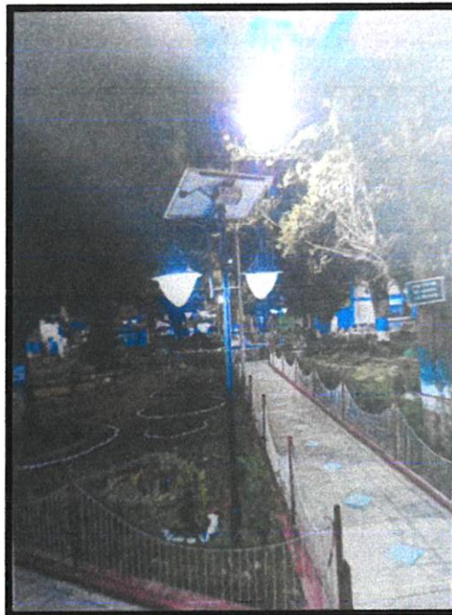
IMAGEN REFERENCIAL DEL MODELO DE LAS ILUMINARIAS SOLARES CON PANEL SOLAR

"MEJORAMIENTO Y AMPLIACION DEL SERVICIO DE ESPACIOS PÚBLICO VERDES EN LAS LOCALIDADES DE POMACocha, YAULI, MANUEL MONTERO, PACHACHACA Y SAN MIGUEL, DISTRITO DE YAULI - PROVINCIA DE YAULI - DEPARTAMENTO DE JUNIN"