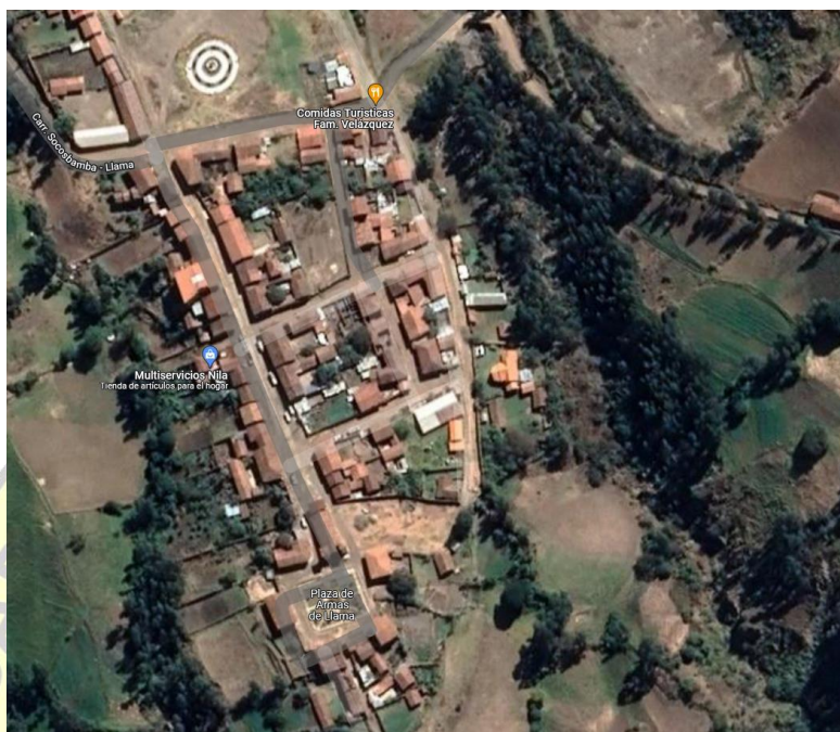
Ubicación del Puesto de Salud Llama (I-2) – Imagen Satelital.