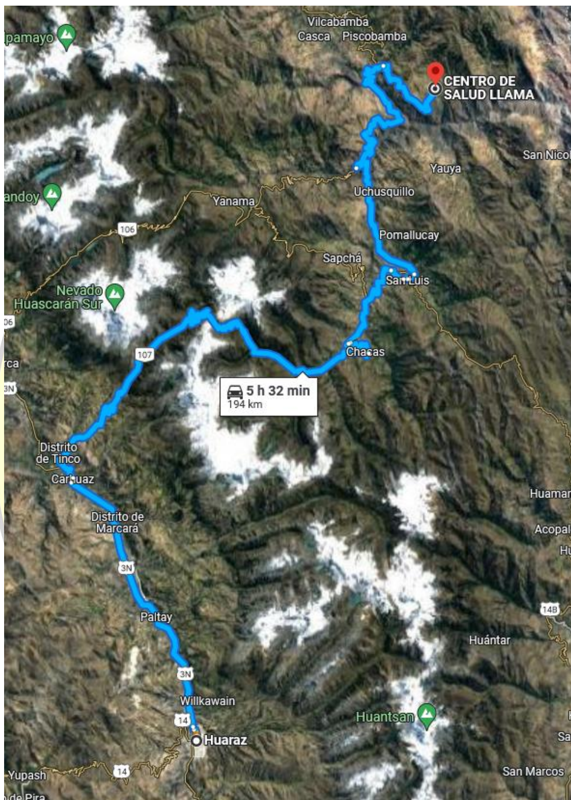
Ruta de acceso desde Huaraz a la localidad de Llama