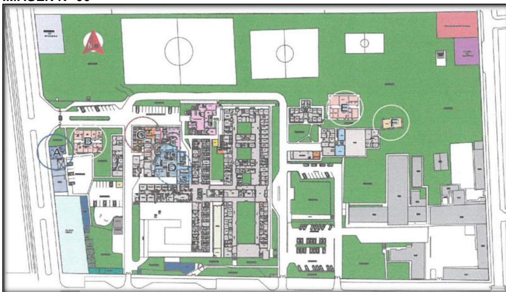
IMAGEN N° 06