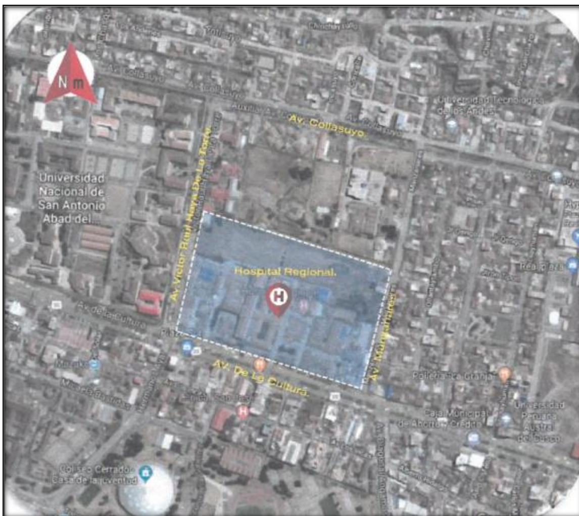
IMAGEN N° 01