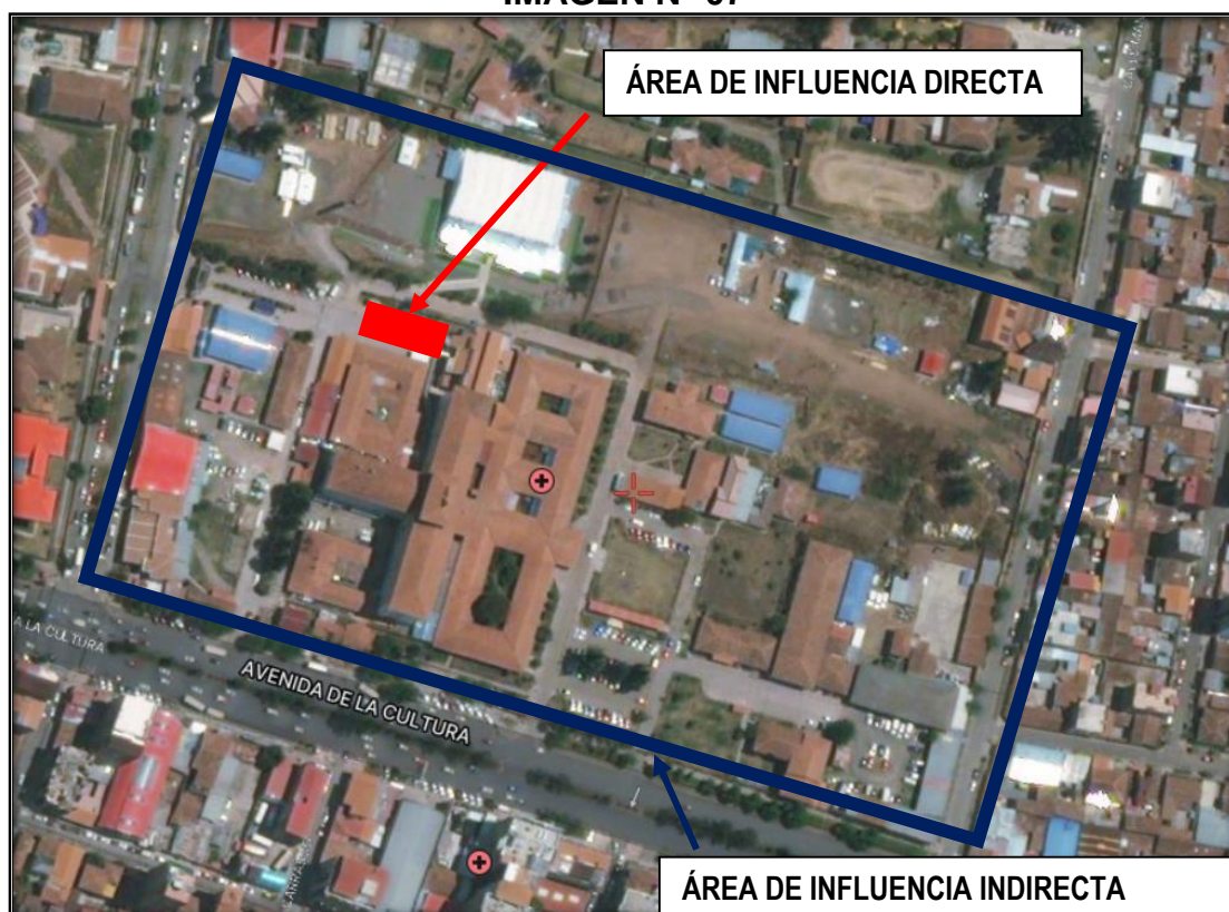
IMAGEN N° 07