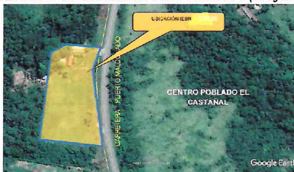
IMAGEN N°01 UBICACIÓN DEL PROYECTO (Grafico)

El horario de recepción de los bienes es de 7:30am a 12:00pm y de 13:30pm a 17:00pm de lunes a viernes y de 7:30am a 12:30pm los sábados