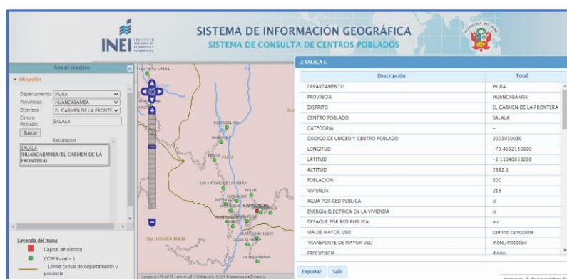
IMAGEN N° 01: CONSULTA DE UBIGEO DE CENTRO POBLADO EN DATA DEL INEI

Se deberá colocar el ubigeo de cada centro poblado del proyecto, según se muestra en la data del INEI. Para esto, se podrá acceder al sitio web: http://sige.inei.gob.pe/test/atlas/ .