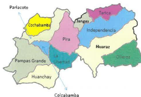
Imagen N° 01: Distritos colindantes de lugar del proyecto. Distritos de la provincia de Huaraz